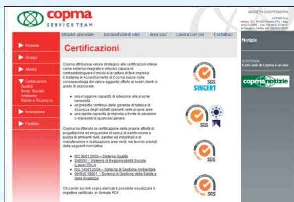
La pagina che raccoglie le certificazioni ottenute: un valore aggiunto alla professionalità ed al know-how applicati nella gestione delle attività di Copma.