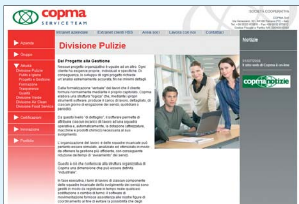
Una delle pagine che illustra le attività svolte. A sinistra, il menù di navigazione permette di visualizzare la struttura delle pagine e di spostarsi facilmente fra i vari argomenti.